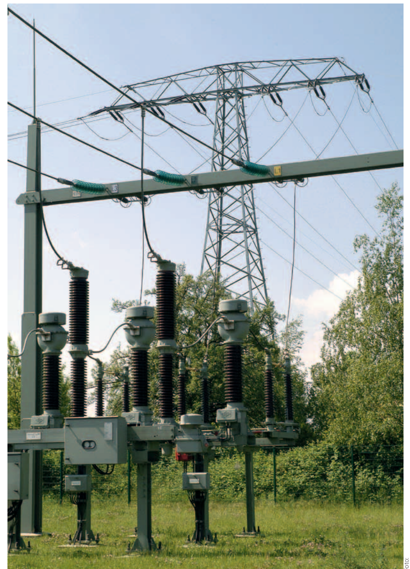
Netzelemente werden im Rahmen des Asset Managements über den gesamten Lebenszyklus hinweg strategisch und kostenorientiert betrachtet.

Der konsolidierte Datenbestand dient als Basis für die vielfältigen Aufgaben im Asset Management. Diese reichen von der Visualisierung unterschiedlicher Asset-Strategien, Ersatz- beziehungsweise Ertüchtigungsmaßnahmen, Kostenoptimierung im Unterhalt, Erstellung des Wirtschaftsplans und Budgetierungsprozesses, differenzierten Wertermittlungen bis hin zu Wirtschaftlichkeitsbetrachtungen von Realisierungsoptionen für